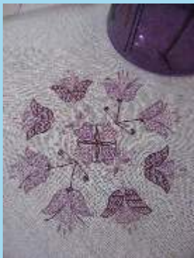
Ricamo d'Assia moderno